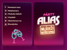
300 karet se slovy