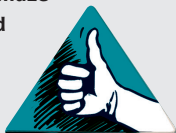
Sázka na tutovku

Tento žeton může jeho majitel využít v kterýkoliv moment hry, pokud není zrovna na řadě. S jeho pomocí si může vsadit na hráče, který je právě na řadě. Pokud tento hráč odpoví správně, sázející vydělá společně s ním příslušný obnos. V případě špatné odpovědi sázející hráč prohraje příslušný obnos. (Pokud zrovna žádné peníze nemá, neprohrává nic.)