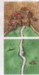
Červený získal 3 body

Tyto body, stejně jako ostatní, musí být ihned zaznamenány na bodové tabulce. (Tabulka má 50 polí, která je možno projít vícekrát dokola. Sčítací figurku, která dosáhne opět prvního pole - 0, položíme. Tak je zřetelné, že hráč má více než 50 bodů.)