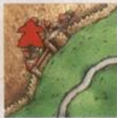
do části města