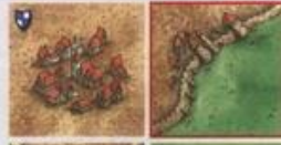
Na jedné straně navazuje část města, na straně druhé kus louky