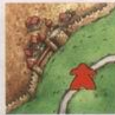
na úsek cesty