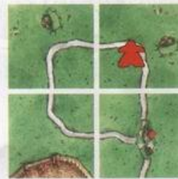
Červený získal 4 body

Cesta je uzavřená tehdy, když ji na obou koncích uzavírá křižovatka, část města nebo klášter, případně když tvoří uzavřený kruh. Mezi těmito konci může být libovolný počet úseků. Za tuto cestu dostane hráč, který na ní má svou figurku, tolik bodů, kolik má cesta úseků (= počet karet, které ji tvoří).