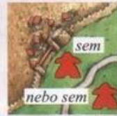
na kus louky